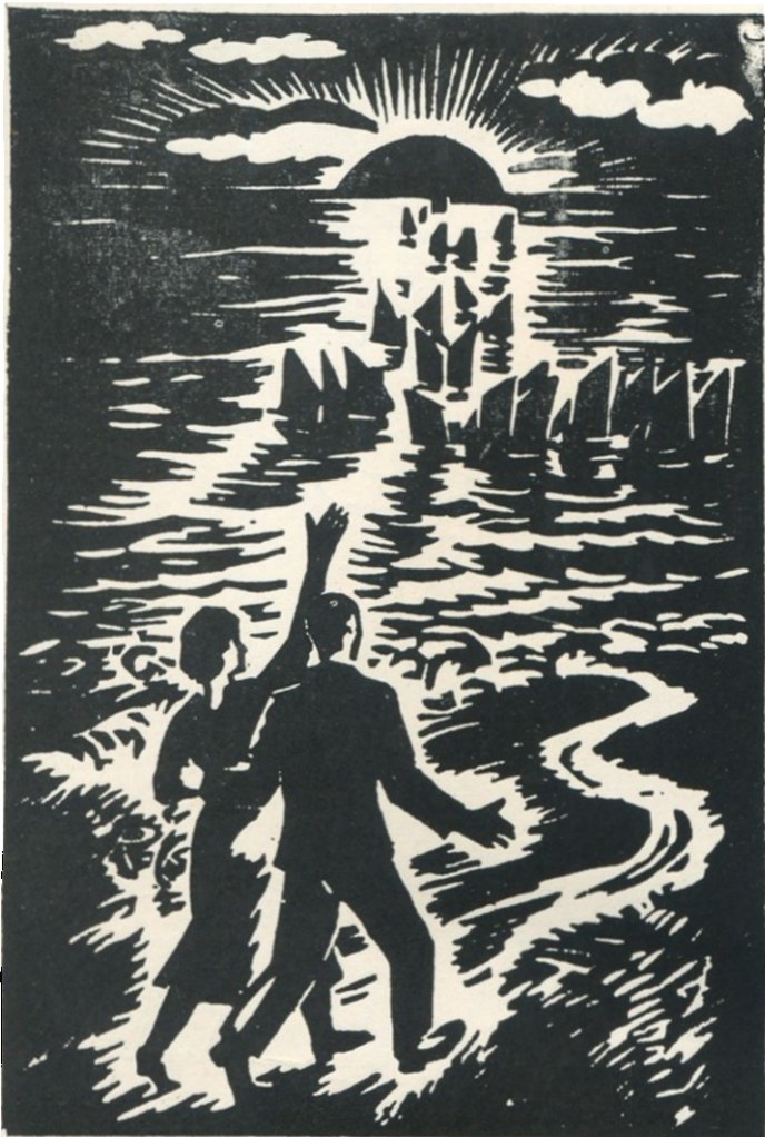
ყრახს ძახუოკლი გოავიუოა ციკლიდა „ძაიდან თეთრისაკენ“ 1939 წ.