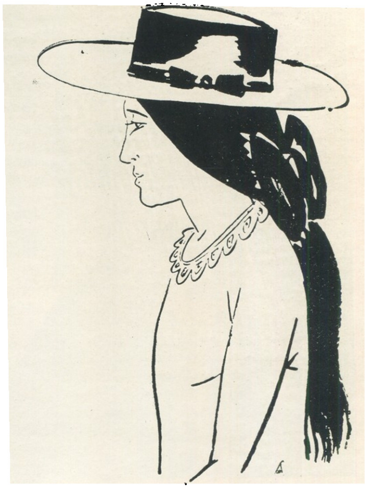
ფრანს მაზერელი „დიდი ქალაქის სურათები“ 1923 წ.

დეგო აზრით. მოყვანილი ილუსტრაცია გვიხატავს ახალგაზრდობის სასიხარულო მომავალს, აღსავსეს რთული და პროდუქციული შრომით.