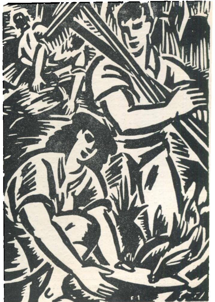
ფრანს მაზერელი კოაკეტრა კელდან „სკაპეკა“ 1948 წ.