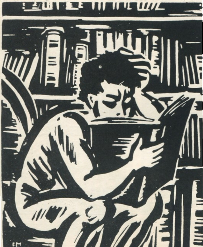
ფრანს მაზერელი გრავიურა ციკლიდან „ცხოვრების ასაკები“, 1948 წ.

ნაწარმოების რთული და თავისებური ფორმის შესაბამისად, იგი, გარდა ძველი გვერდის ზომის დიდი გრავიურებისა და ტექსტში ჩართული მცირე ვერტიკალური ან პორტრეტული, ილუსტრაციებისა, აკეთებს კიდევ პატარა ნახატებს ტექსტის არძიებზე და დიდ ბოლოსართებს, რომლებიც თითქოს აჯამებს ეპოქის მთელ ნაწილებს. ეს ნახატები შესრულებულია საგანგებოდ გამომუშავებული განსხვავებული მანერით: კარიკატურა პაწაწა-კინტელა, მლიქვენელურად მოხრილი ფიგურები პერსონაჟის ფეხების ფიგურათა, რომელიც საზღერ-ოთხჯერ სჭარბოია ძათ, — ეს ხერხი სათახადო გადამუშავებით იშვორებს იმ ხერხს, როდელააც შუასაუკუნიებში იყენებდნენ კტიტორთა გამოსახატავად. ეს გრავიურაც თითქოს მხოლოდ ხაზებითაა ამოკვეთილი, იგი სრულიად ღია ფერისაა, ძირითადი ილუსტრაციებისაგან განსხვავებით.