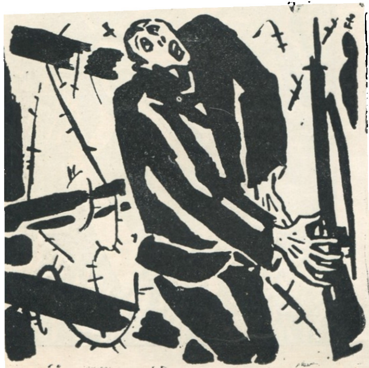
ფრანს მასჩერელი ნახატ გავითხასთვის „La Faulle“ 1917 წ.

და, და მე ვგრძნობ, ომი ძალზე დამეხმარა, რომ ეს გასაგები გამხდარიყო ჩემთვის“.