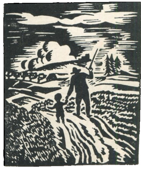
ფრანს მაზერელი „უან-კრისტოფის“ ილუსტრაციები 1925-27 წ. წ.