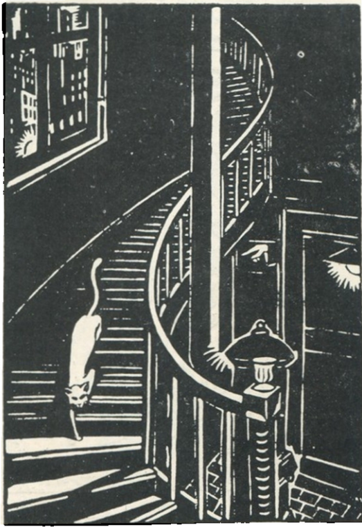
ფრანს მაზერელი ნახატი „ენ-კრისტოფისათვის“

მელიც „დედაქალაქის“ სახელწოდებას ატარებს, არის სარკაატული კომპოზიციები ბურჟუაზიულ დემოკრატიაზე.