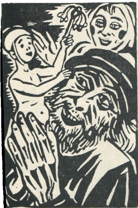
ფრანს ძახერელი „უღელმთიანეთის“ ილუსტრაციები

ნაწილებს გამოფენებზე ზეთითა და აკვარელით შესრულებული სურათებით, რომლებშიც მძიმე და მუქი ტონები ჭარბობს — მუქი მწვანე, მუქი ლურჯი, ყავისფერი, მუქი ნაცრისფერი. სიუჟეტები უმთავრესად ქალაქის წერეულ, დაძაბულ, კონტრასტებით სავსე ცხოვრებას ასახავს ან ბულონის ახლოს მუდამ მღელვარე ზღვის სანაპიროს,