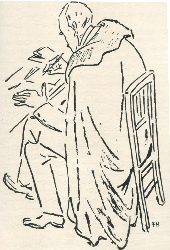
ფრანს მაზერელი რომენ ბოლანი. 1921 წ.

როგორც კი დამთავრდა ომი და დაიწყო მშვიდობიანი ცხოვრება, მაზერელს, რომელიც ომის დროს სამხრეთ საფრანგეთში ცხოვრობდა ბორდოს მახლობლად, ახალი თემები და ახალი იმედები შთააგონებენ. 1948 წელს პოემას პოემაზე ჰქვინს: „ცხოვრების ასაკები“, „სიჭაბუკე“ შედგება გრაფიკურებისაგან ისევე, როგორც მის მიერ ილუსტრირებული მხატვრული ლიტერატურის ნაწარმოებები. ორივე ეს სერია გამსჭვალულია კაცობრიობისადმი და მისი ნათელი მომავლისადმი რწმენით. ჩვენს წინ იშლება ცოდნას დაწაფებულთა სურათები, მეცადინეობა სკოლაში, კითხვა, კოლექტიური შრომა, ახალგაზრდა ოჯახის ხალისიანი ცხოვრება, ბავშვების აღზრდა და რიტმული შრომა. „სიჭაბუკე“ ტომას მანის შესავლით გამოიცა. მანი ასეთი სიტყვებით აკეთებს დასკვნას: „ჩვენ მოგიწოდებთ თქვენ იმედი იქონიოთ“. ამ გრაფიკურებს მაზერელი ასრულებს მკაფიო და ფართო შავი ხაზებით გამოკვეთილი ნახატებით, ხერხით, რომელიც მან შეიმუშავა ციკლში „თეთრიდან შავისაკენ“, მაგრამ უკვე საწინააღმ-