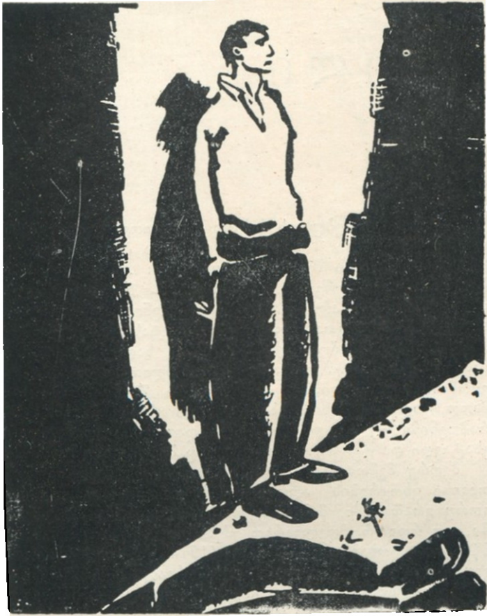
ფრანს მასჩერელი გრაფიკა სერიიდან „ადამიანის ტანჯვის 25 სურათი“, 1918 წ.

სევდიანი ვიყავი, მიუხედავად იმისა, რომ შემიძლია ძალიან კმაყოფილი და მხიარული ვიყო. მე ცხოვრების, ქუჩის, ნავსადგურთა ჩანახატების მთელი დაატა მაქვს. ყოველთვის ბევრს ვმუშაობდი, მაგრამ მხოლოდ ჩემთვის. ყოველივე ამის უღრმესი აზრი კი ხელიდან მისხლტებო-