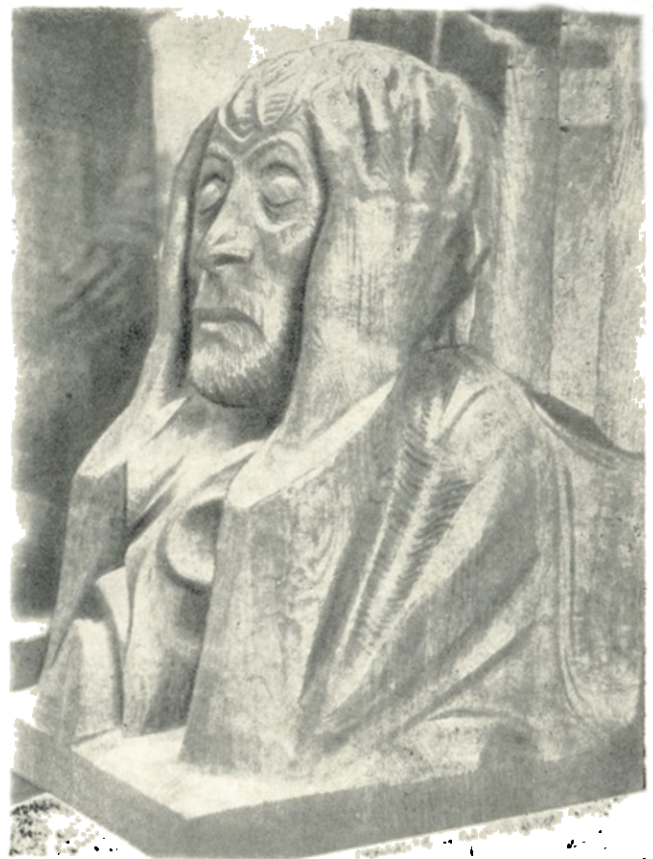
ე. ბარლახი დაღუპულ მეომართა ძველი მაგდებურგში (ღებლი)

მიუხედავად ნაცისტთა ასეთი ვერაგული შემოტევისა, ბარლახს არასოდეს მიუტოვებია მუშაობა თავის სახელოსნოში, რომელიც ნაცისტთა მეთვალყურეობის ქვეშ იმყოფებოდა და იზიარებდა თუ ესტუმრებოდა ხოლმე ვინმე ბარლახის მეგობართან. 1931-32 წლებში ბარლახმა დიდი სამუშაო წამოიწყო: მას განზრახული ჰქონდა ლუბეკში მე-13 საუკუნის ტაძარი უშარმაზარი ფიგურებით (სიმაღლთ 2 მ) შეემკო. ფიგურები ტაძრის ფასადის ნიშებში უნდა მოთავსებულიყო. განზრახული 16 ფიგურიდან ბარლახმა მხოლოდ სამის დამთავრება მოასწრო და დადგა კიდევ ისინი თავთავის ადგილზე (მათხოვარი ხეიბარი, ქალი ქარში, მომღერალი მორჩილი). ფიგურები კლინიკებისგან იყო გამოძერწილი — ბარლახი აქაც ანგარიშს უწევს არქიტექტურას: შენობა აგურისაა. რაღა თქმა უნდა, ნაცისტებმა ყველა დონე იხმარეს და სკულპტორის ჩანაფიქრი განუზოროცილებელი დარჩა. მაგრამ მათ იმასაც მიადრეეს, რომ დამთავრებული ფიგურებიც ჩამოიღეს ტაძრიდან.