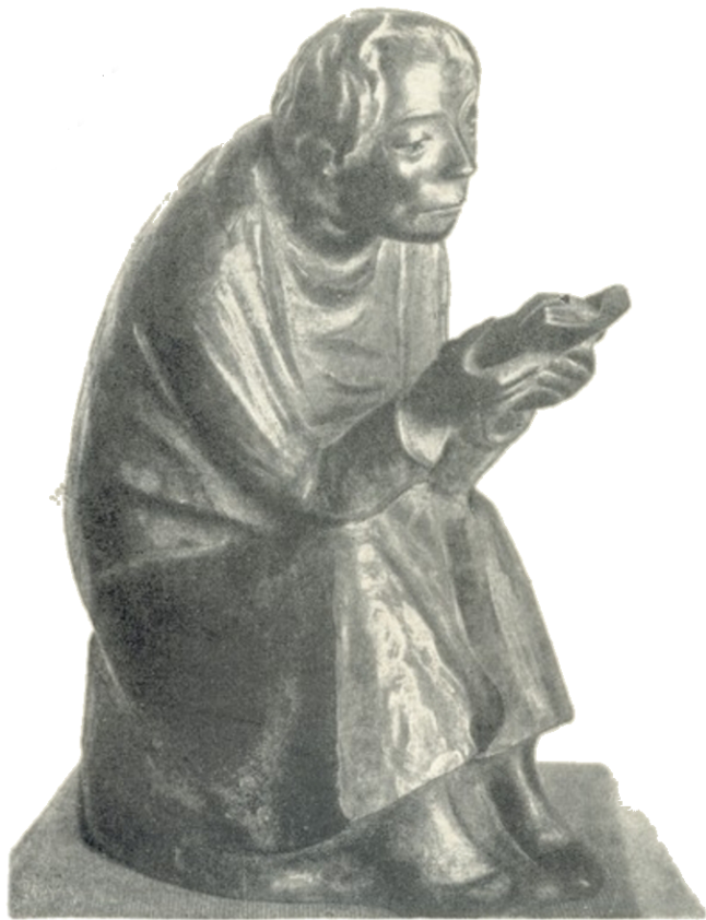
ე. ბარლახი წიგნს კითხულობს. (1936. ბრ-ნჯაო)

1957 წელს, 20 წლის შემდეგ, გერმანიის დემოკრატიული რესპუბლიკის მთავრობამ მაგდებურგის ძეგლი თავის პირვანდელ ადგილს დაუბრუნა, ისევე, როგორც ბარლახის სხვა ძეგლებიც.