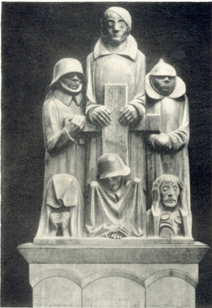
ე. ბარლახი დიდებული მეომარი ქველი მაგლებურგში (1929. ხე)

ბერი; დავრდომილი, ბრმა და მთხოვარა ქალი; მისი უდიდებულესობა მათხოვარი; მათრახი; განკიცხულნი; რუსი მთხოვარა დედაკაცი; სასოწარკვეთილება და აღშფოთება; დავრდომილი მათხოვარი; გაჩანაგება. ეს წარწერები ნათლად მეტყველებს, როგორი იყო ბარლახის დამოკიდებულება ომი-სადმი, ომის პროცესისადმი და მისი შედეგებისადმი. გრაფიურაზე „მათრახი“ გამოსახულია უზარმაზარი გააფთრებული ფიგურა, რომელიც მათრახს სცემს მის ირგვლივ შეყუჟულ პაწია კაცუნებს. ძუნწი ნახატი, სულ რამდენიმე ხაზით, რომელიც აქა-იქ ერთვის კონტურებს, ზოგან თითქმის უბრალო მონახაზით მეტად მკაფიოდაა გადმოცემული თემა. გრაფიურა — „სასოწარკვეთილება და აღშფოთება“, შემდეგ სურათს გვიხატავს: მიწაზე ზის ფეხებგამოტილი დედაკაცი, მთლად შალში გახვეული, შიშით მოკუნტული და აცახცახებული; ზევიდან მას გადაფარებია მამაკაცის ფიგურა — უბრალო გლები. გრძელი ჩამოფლეთილი პერანგის ამარა, რომელსაც მარჯვენა ხელი, იდაყვამდე გამოშვლებული, ზევით აუშვერია მექარის ნიშნად; იგი წყველა-კრულვას უთვლის ღმერთს. ორი ფიგურა: სასოწარკვეთილი, განწირული ქალი და აღშფოთებული, ამბოხებული მამაკაცი!