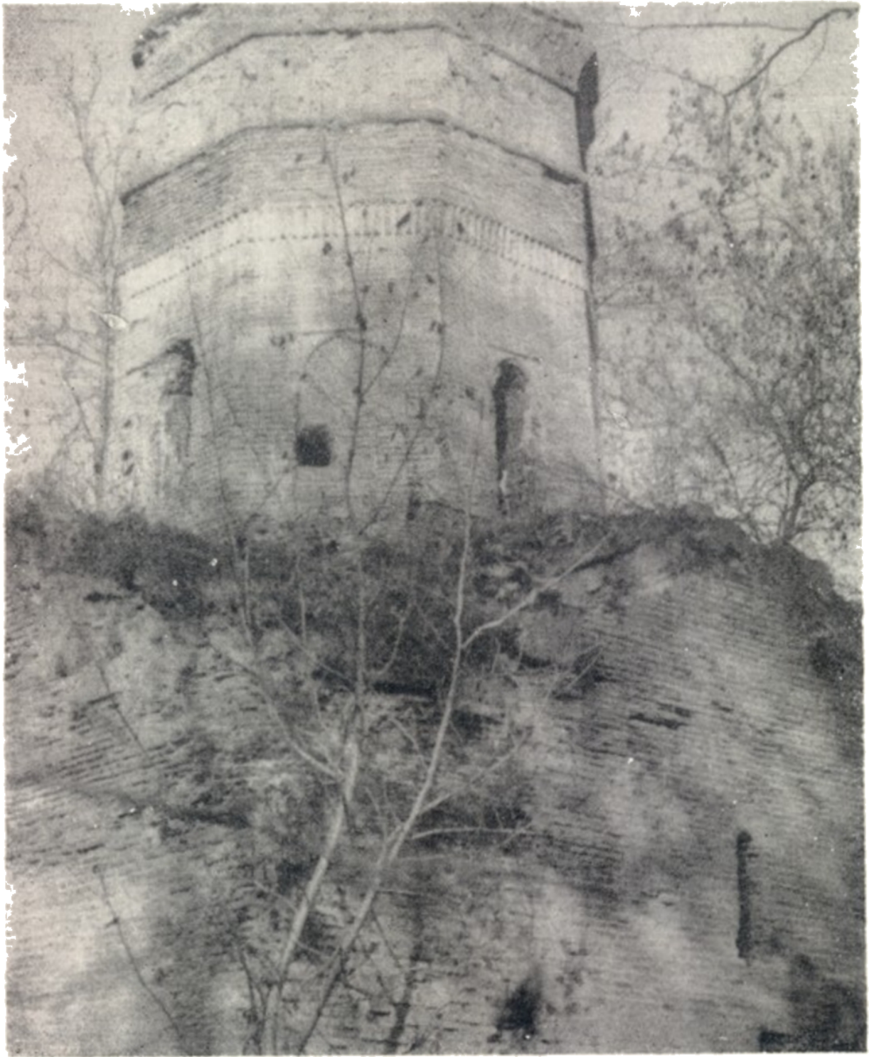
წმინდა ნიკოლოზის ტაძარი ავეთქებამდე

ლობას, მაგრამ სწორედ აქ უნდა გამოჩნდეს ძეგლებისადმი ზრუნვა. არცერთი ახალი მშენებლობისათვის აუცილებელი არ არის ძველი, საყურადღებო ძეგლის შეწირვა. ახლა მრავალი საშუალება არსებობს... სულ ადვილია ძეგლის გადანაცვლება, როგორც ეს მოხდა თიანეთის სიონის მიმართ, ან გზის ახალი ვარიანტით შემოვ-