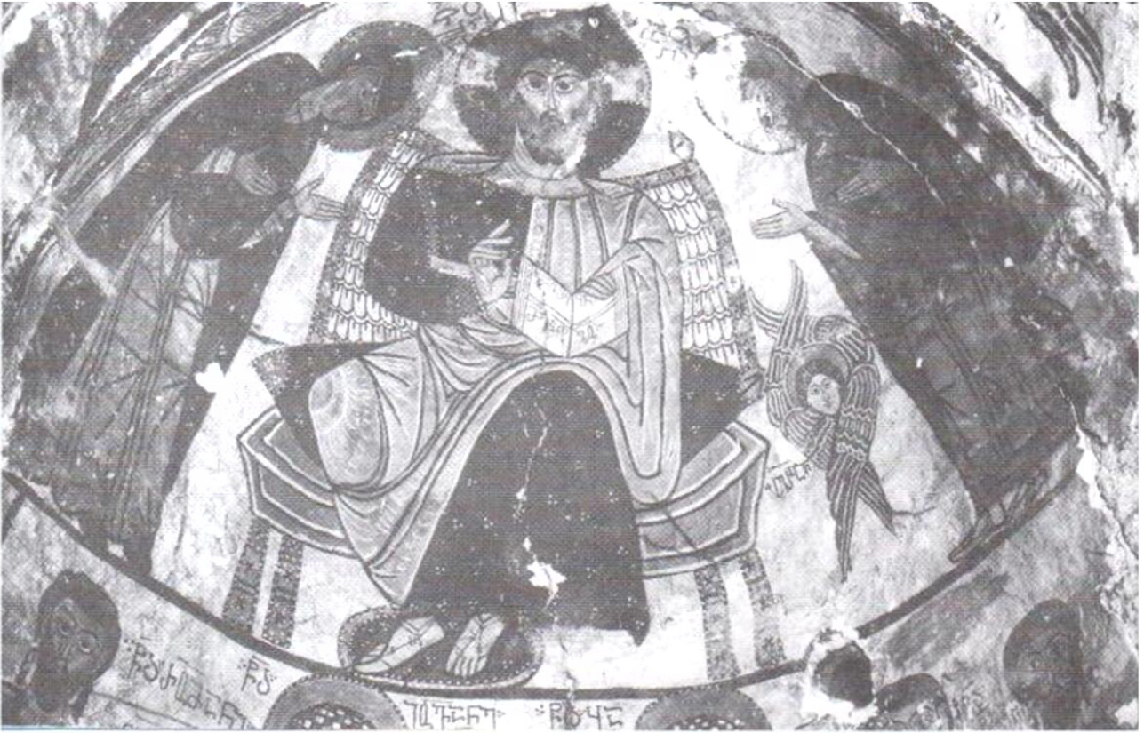
სურ. 5. საკურთხეველის კონქი