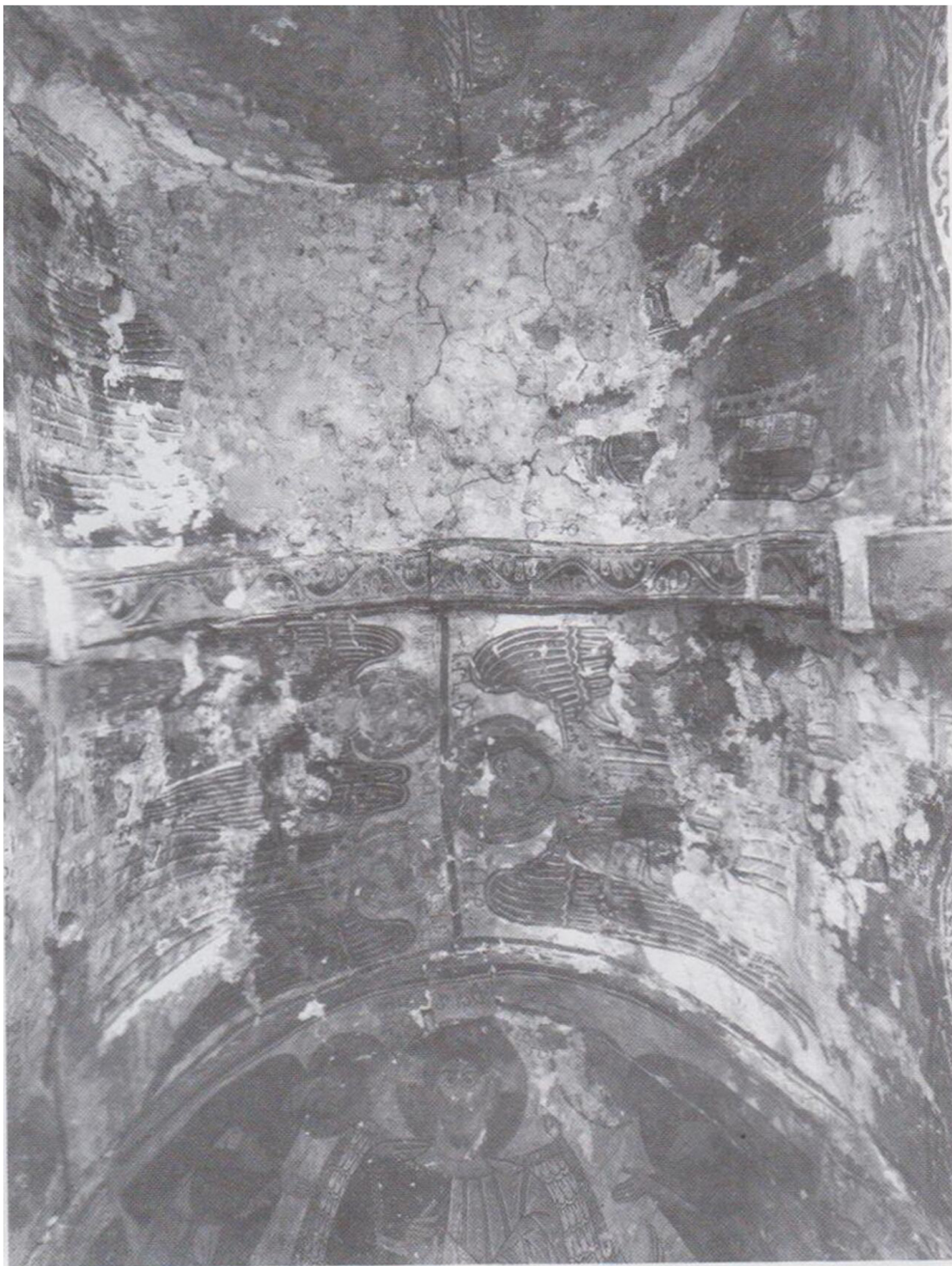
სურ. 4. კამარის მოხატულობა