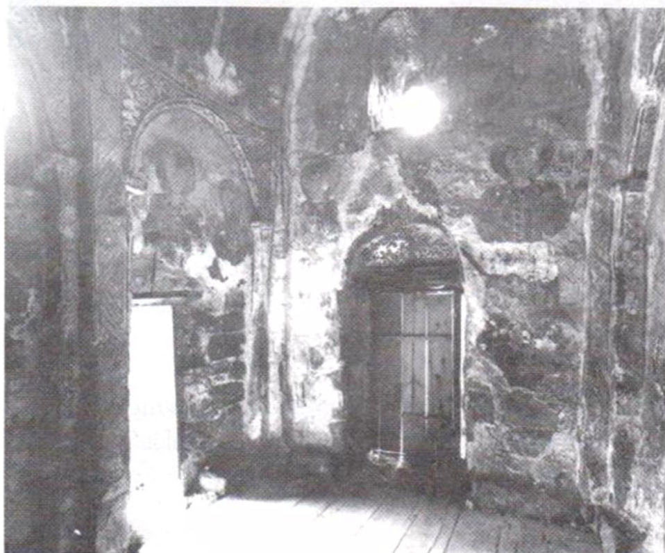
სურ. 3. მთაწმინდის სამხრეთ-დასავლეთი მონაკვეთი