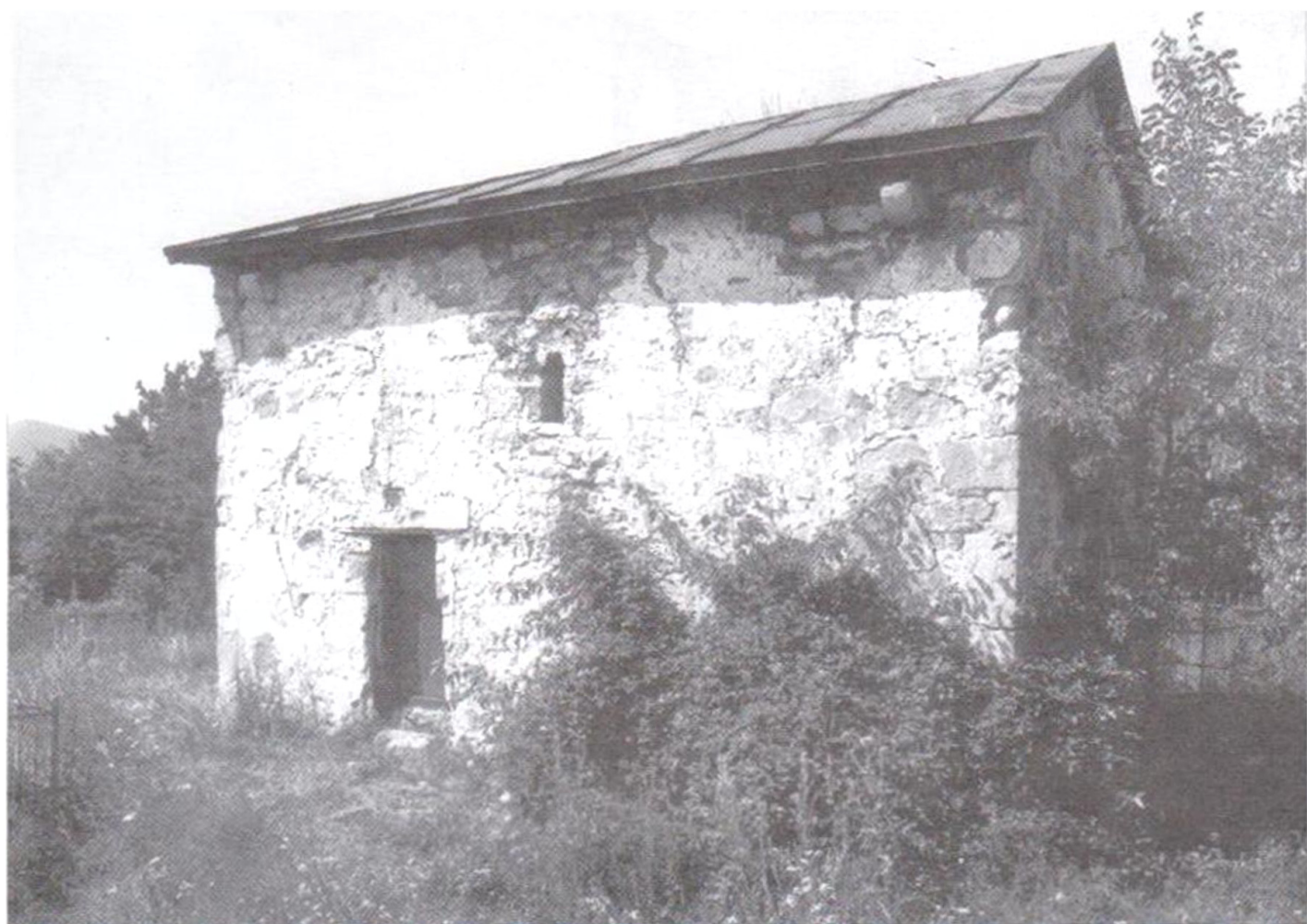
სურ. 1.* ფარახეთი, საერთო ხედი