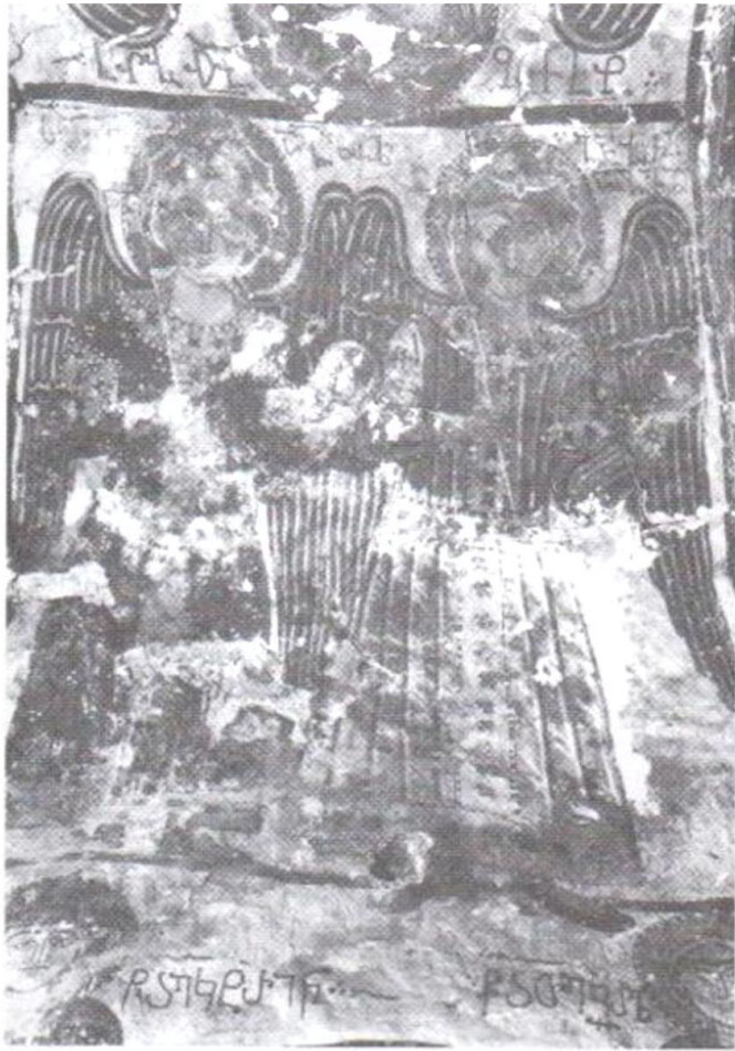
სურ. 8. მთავარანგელოზნი სურ. 9. ქტიტორები სურ. 10. წმ. გიორგი