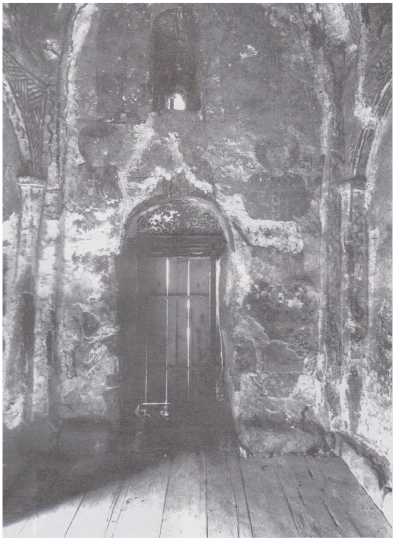
სურ. 7. მოხატულობის დასავლეთი მონაკვეთი