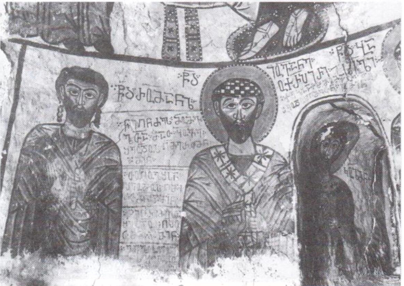
სურ. 6. წმ. მღვდელმთავრები