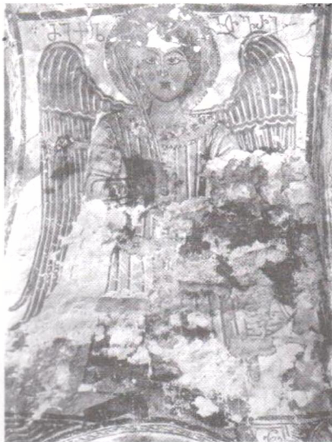
სურ. 11 მთავარანგელოზი სურ. 12. მოხატულობის სამხრეთ- აღმოსავლეთი მონაკვეთი სურ. 13. წმ. მოწამენი