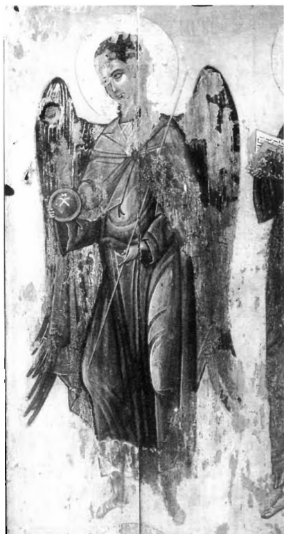
4. Petit triptyque d'Oubissi, volet droit (détail de la Fig. 1). L'archange Michel