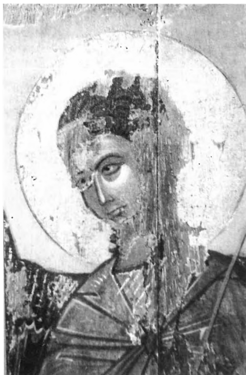
5. Petit triptyque d'Oubissi, volet droit (détail de la Fig. 1). Visage de l'archange Michel