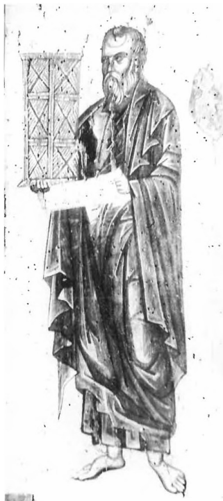
8. Grand triptyque d'Oubissi, panneau central (détail de la Fig. 2). Le prophète Ezéchiel