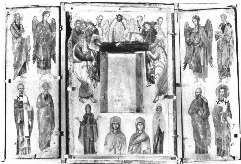
1. Tbilisi, Musée National des Beaux-Arts de Géorgie, no. 613, petit triptyque d'Oubissi