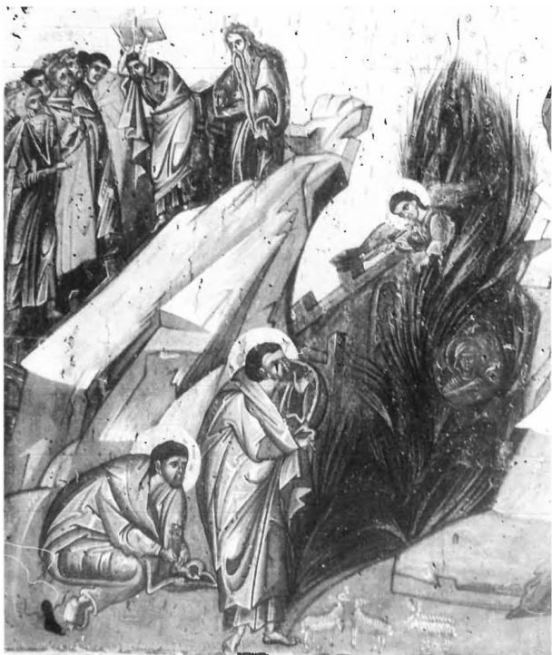
6. Grand triptyque d'Oubissi, panneau central (détail de la Fig. 2). Moïse rompant les Tables de la Loi et Moïse devant le buisson ardent