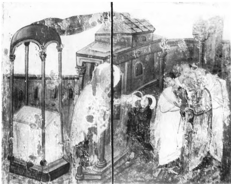
7. Grand triptyque d'Oubissi, volet droit (détail de la Fig. 2). Épreuve de l'Eau