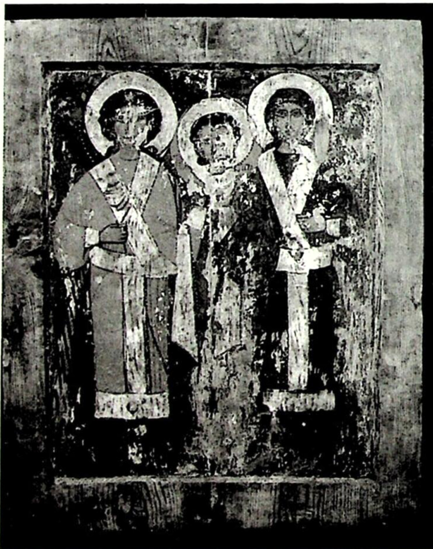
3. მთავარანგელოზთა კრება, სიემ (სვანეთის ისტორიისა და ეთნოგრაფიის მუზეუმი)