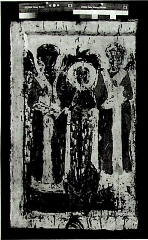
2. მთავარანგელოზთა კრება, წმ. გიორგის ეკლესია. ს. ლახუშტი