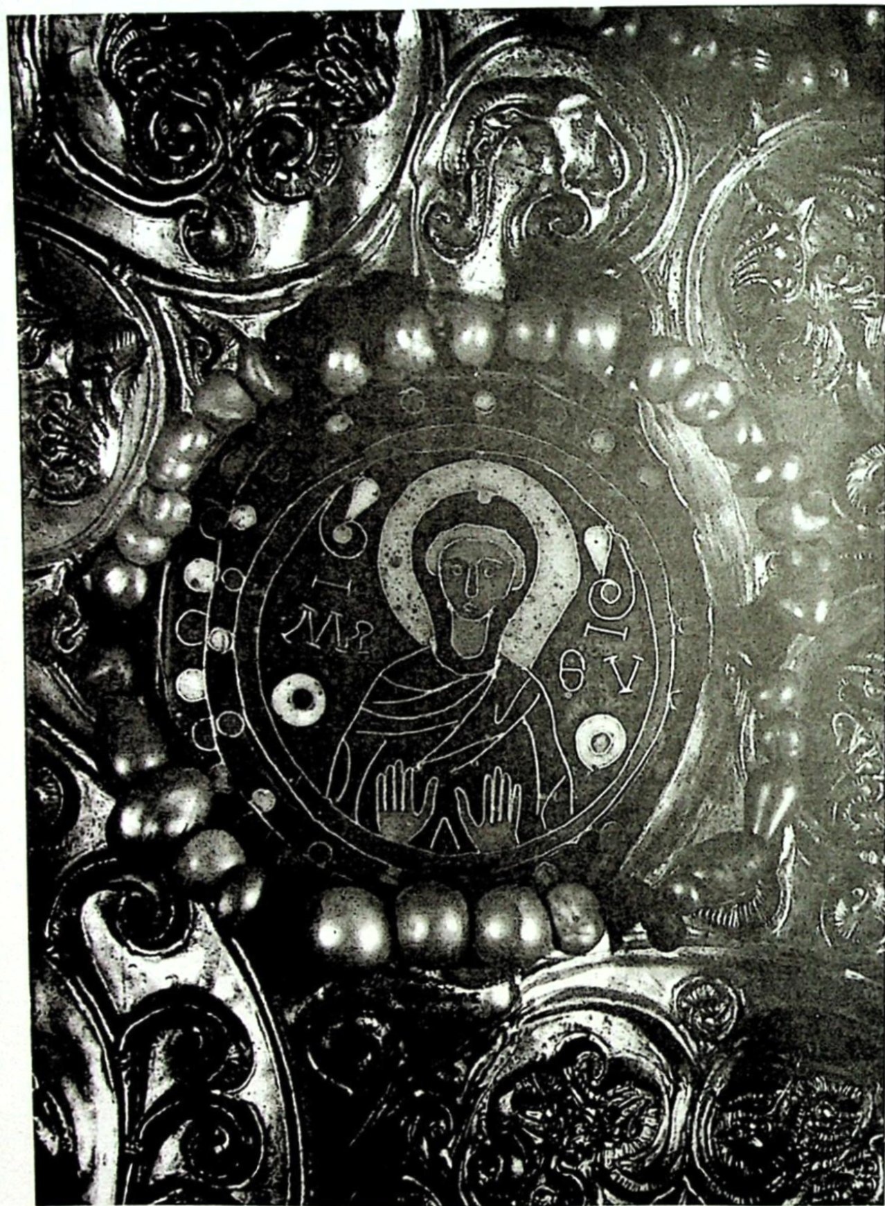
3. ხახულის კარედი. ღმრთისმშობელი - მცირე ორანტა. შინანქარი. IX ს.