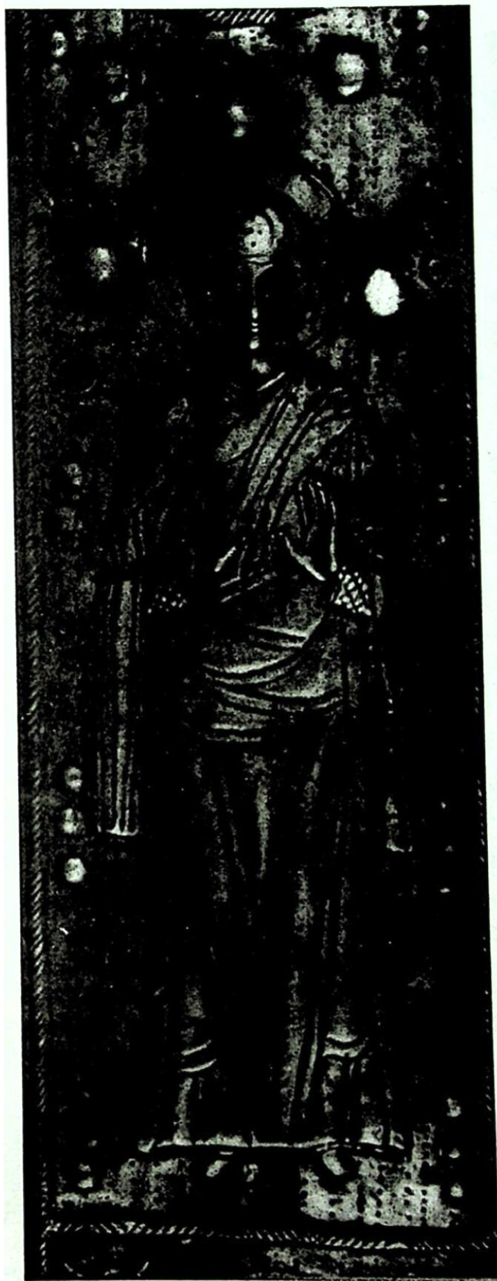
2. უშგული. ვერცხლის ჯვარი. ღმრთისმშობლის გამოსახულება