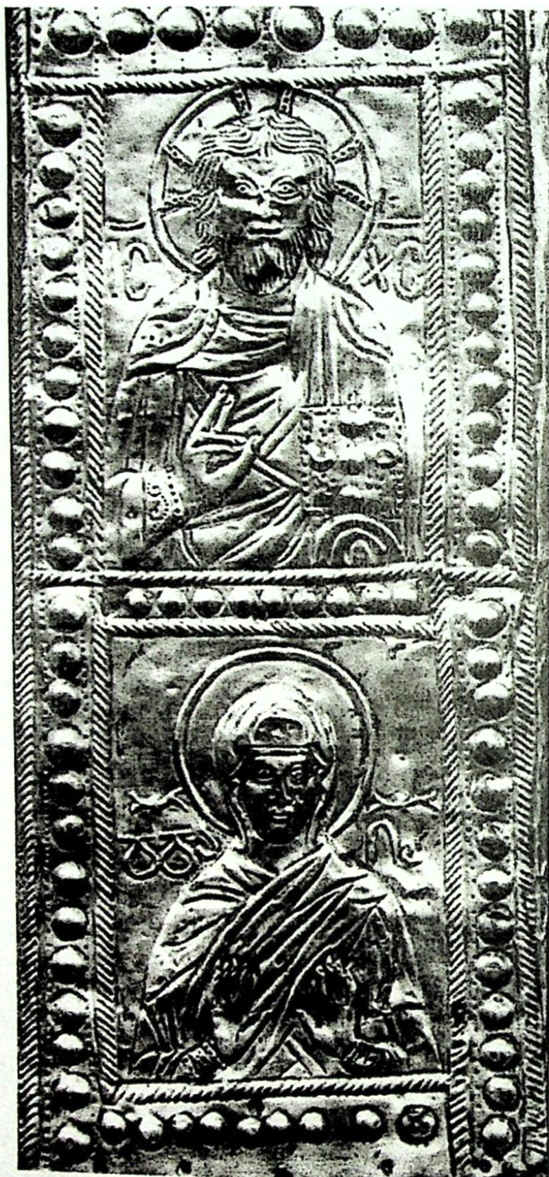
5. ბეზო. ვერცხლის ჯვარი. ფრაგმენტი. მცირე ორანტა. XII ს.