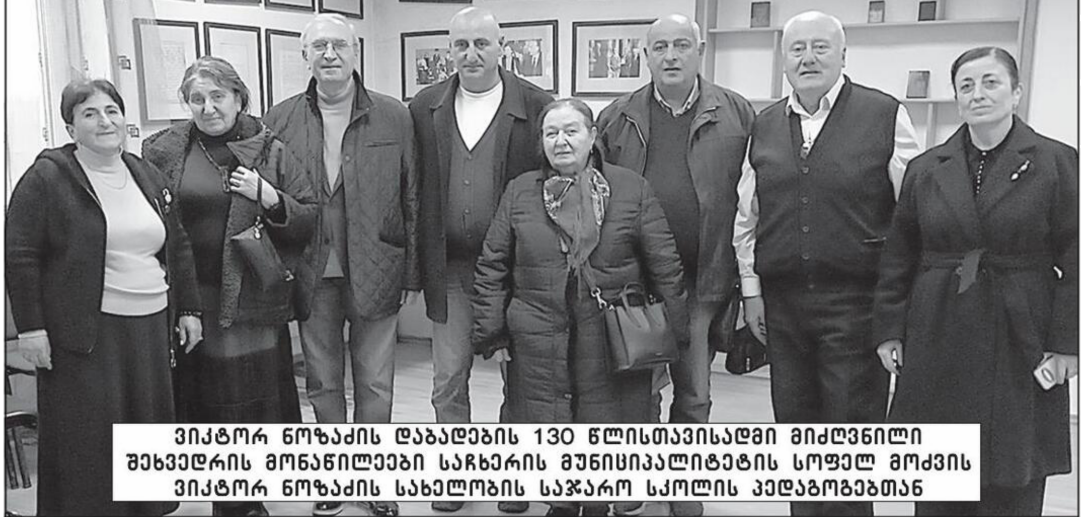
ვიკტორ ნოზაძის დაბადების 130 წლისთავისადმი მიძღვნილი მხეხვედრის მონაწილეები სარხარის მუნიციპალიტეტის სოფელ მოქვის ვიკტორ ნოზაძის სახელობის საჯარო სკოლის პედაგოგებთან

„ვიკტორ ნოზაძის საზოგადოების“ მიერ უკვე გამოცემულია ოთხი ტომი: „ვეფხისტყაოსანის“ ფერამეტყველება, „ვეფხისტყაოსანის“ ვანსკვლათმეტყველება, „ვეფხისტყაოსანის“ მხისმეტყველება, „ვეფხისტყაოსანის“ საზოგადოებრივმეტყველება. მათგან სამი ტომი მომზადდა გურამ შოთაძის რედაქტორობით. მეოთხე ტომი გამოსაცემად მოამზადა თამაზ ტყემლაძემ. ამჟამად გამოსაცემად მომზადებულია „ვეფხისტყაოსანის ღმრთისმეტყველება“. ვიკტორ ნოზაძის ეს მიწნოგრაფია მოყუ-