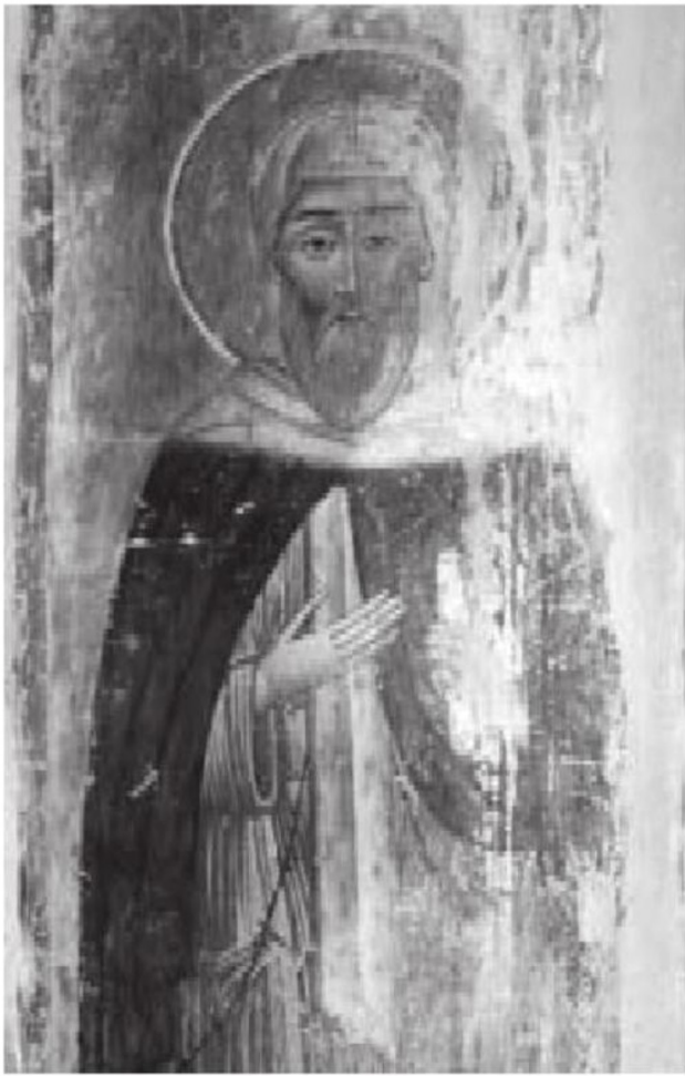
სურ. 6. პიროს ბრეთელი