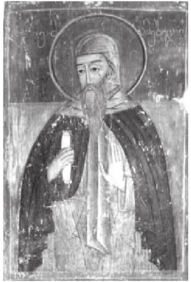
სურ. 7. თათე სამეხელი