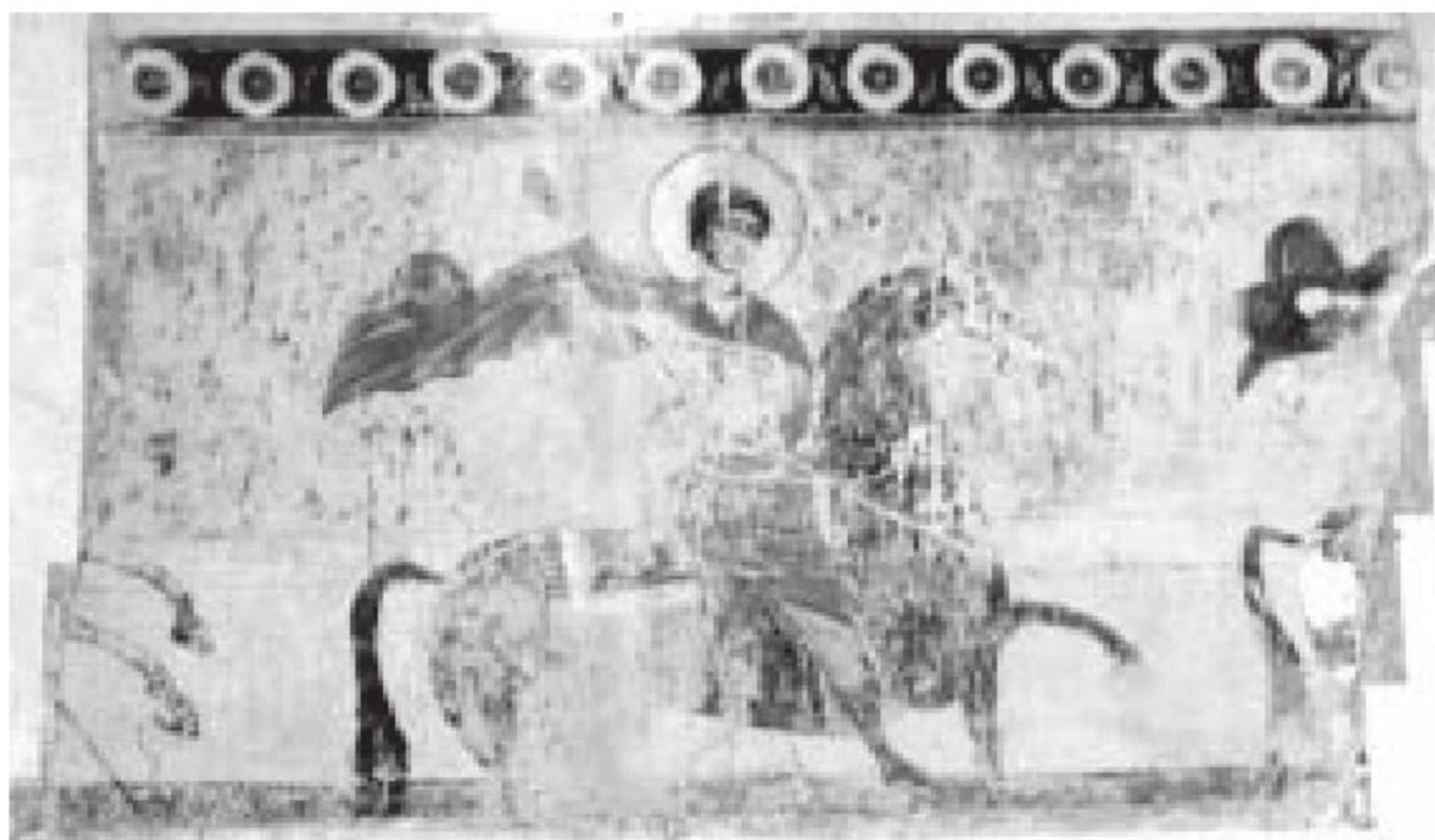
სურ. 1. ანანური. ღმრთისმშობლის მიძინების ტაძარი. V მ. მხედრები