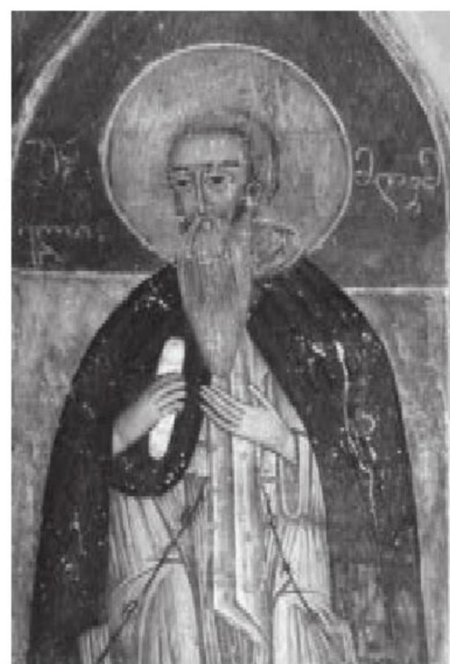
სურ. 5. შიო მღვიმელი