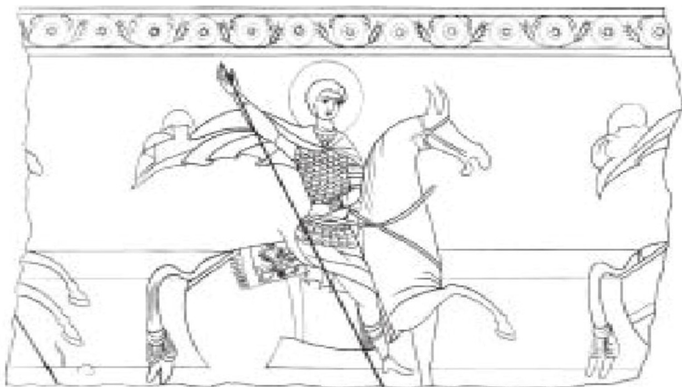
ნახ. 1. ანანური. ღმრთისმშობლის მიძინების ტაძარი. V მ. მხედრები (სქემა)