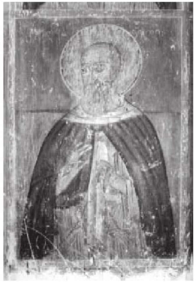
სურ. 9. ისე წილკნელი