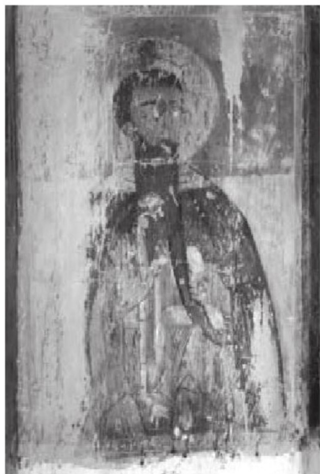
სურ. 4. დავით გარეჯელი