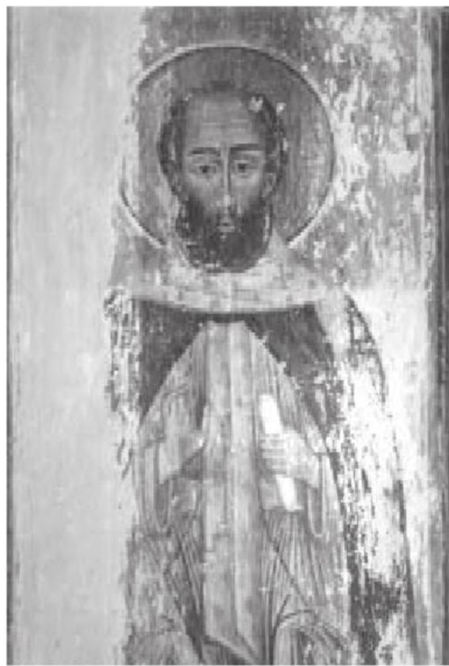
სურ. 3. არსენ იყალთოელი