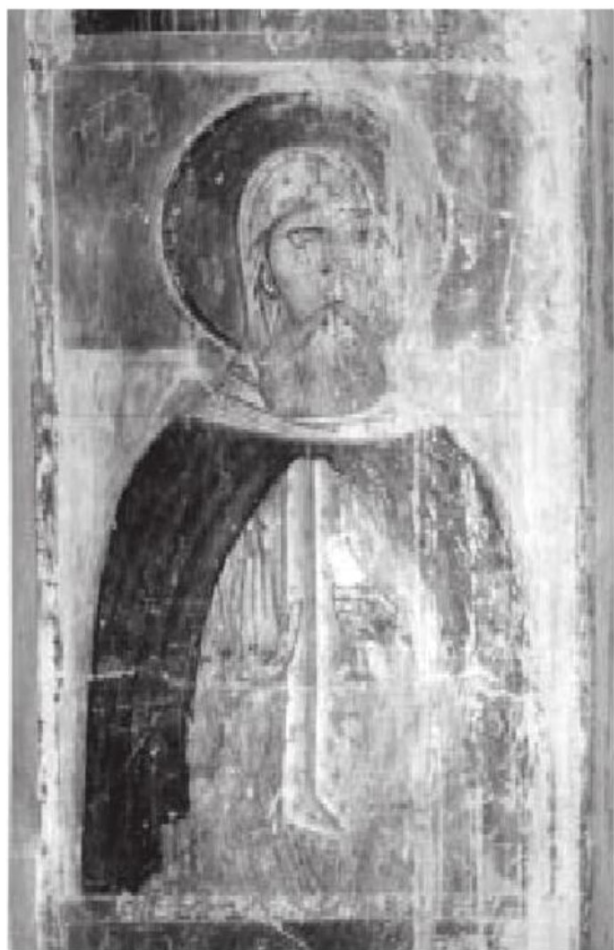
სურ. 10. იოსებ აღავერდელი