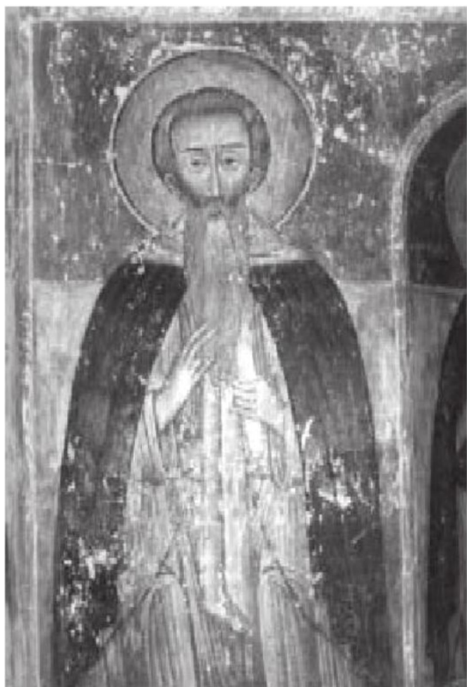
სურ. 2. ანტონ მარტყოფელი