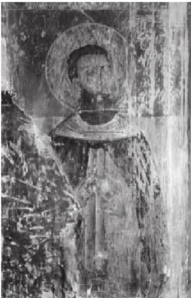
სურ. 8. ისიდორე სამთავნელი