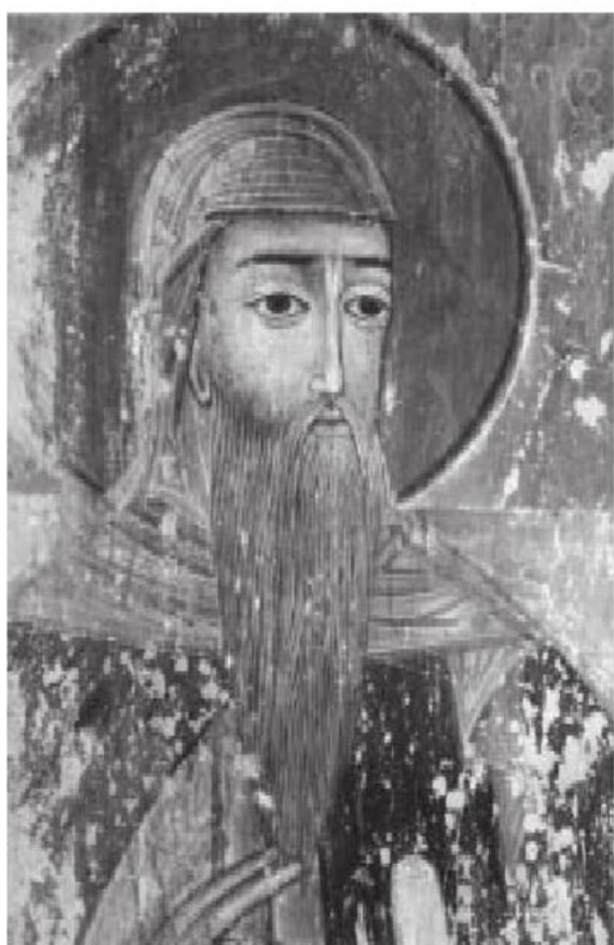
სურ. 12. იოანე ზედაზნელი