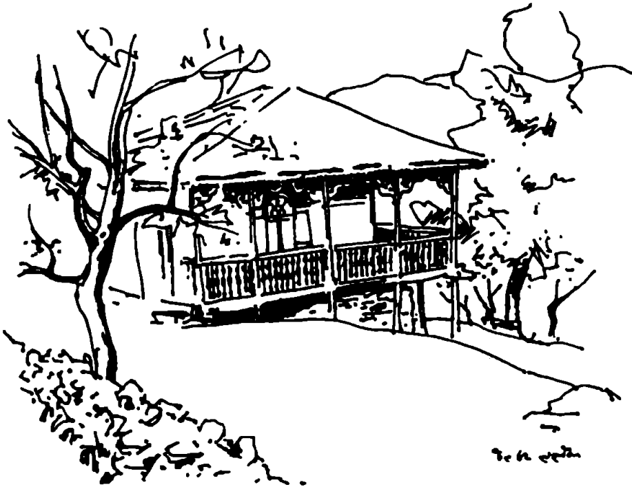
ნახ. 1. კოლხური ოდა-სახლი. რაჭა. სოფ. ლადიში

ოდა-სახლის ინტერიერს, „შინას“ იმ ხარისხის საკრალიზაცია აღარ გამოარჩევს, როგორც დარბაზისას, თუმცა ისიც ხაზგასასმელია, რომ ამ თვისობრიობას მოკლებული ჯერაც არაა. ამის უცილობელი დასტურია, ე. ნადირაძის დაკვირვებით, სიცოცხლის ხის მოტივით შემკული, კერის ჩამანაცვლებელი ბუხარი. ასევე