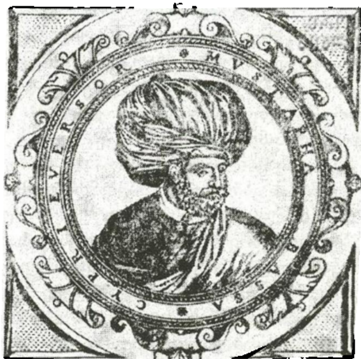
ლალა მუსტაფა ფაშა

იმავე დღეს ვარაზა ოღლუ მაჰმუდ ხანმა ვალეს ციხე ბრძოლით აიღო. 4 თოქმაქ ხანმა ამირ ხანსა და იმამ ყული ხანს კაცები გაუგზავნა და ურჩია, როდესაც ოსმალები საზღვარზე გადმოვიდოდნენ, ერთად შეკრებილიყვნენ და საჭირო გეგმა შეემუშაებინათ. მაგრამ იმამ ყული ხანი ყარაბაღის ლაშქარს შეუერთდა, თურქმენ ამირ ხანმა კი, თოქმაქ ხანის შემადგენლობაში მყოფ