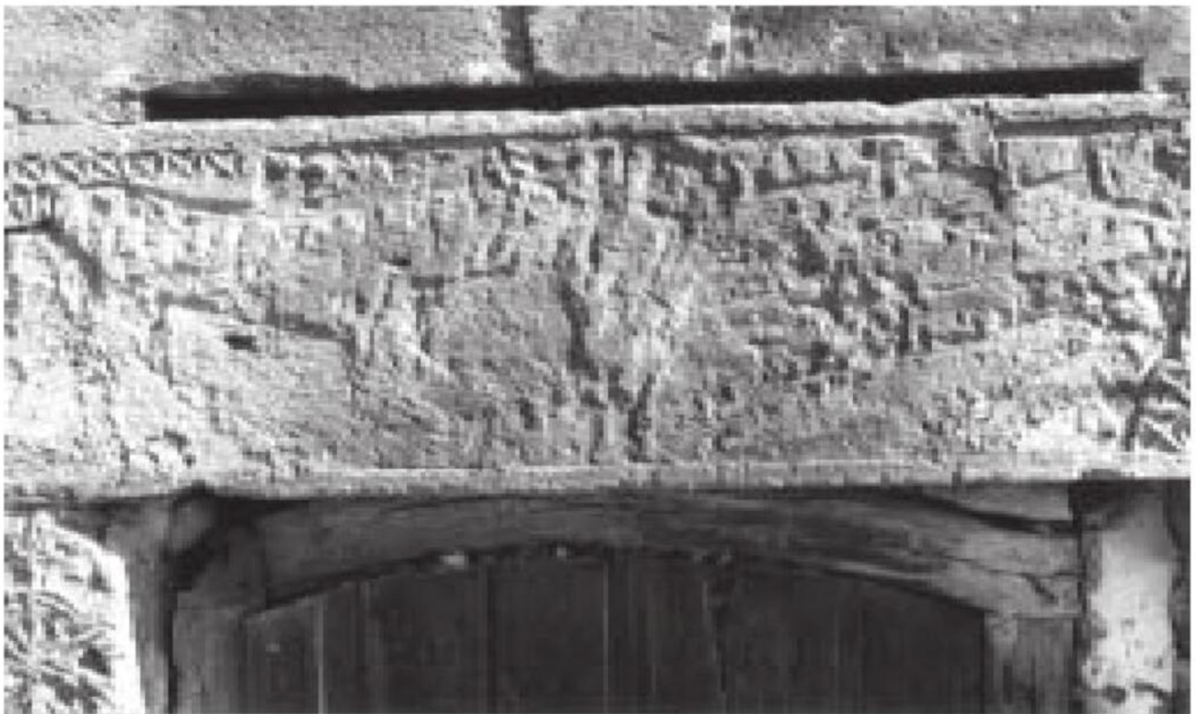
სურ. 4 აკაურთა. ეკლესიის სამხრეთი კარის არქიტრავის შუა მონაკვეთი