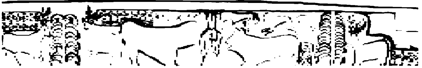
ნახ. 1. აკაურთა. ეკლესიის არქიტრავის რელიეფი (სქემა)

ამ საგნის მეტად პირობით-სქემატური ფორმის გამო, ძნელია დაბეჯითებით ითქვას, თუ რას წარმოადგენს იგი და რატომ არის შეყვანილი ამ კომპოზიციაში. გამორიცხული არ უნდა იყოს, რომ ეს გამოსახულება მართლაც წარმართული საკურთხევლის – სამსხვერპლოს გარკვეულ ინტერპრეტაციას წარმოადგენდეს. საყურადღებოა, რომ დანიელის სცენაში ღომები მოძრავ, მრბოლავ პოზებში არიან გამოსახულნი (განსაკუთრებით მარჯვენა მხარეს წარმოდგენილი ღომები),