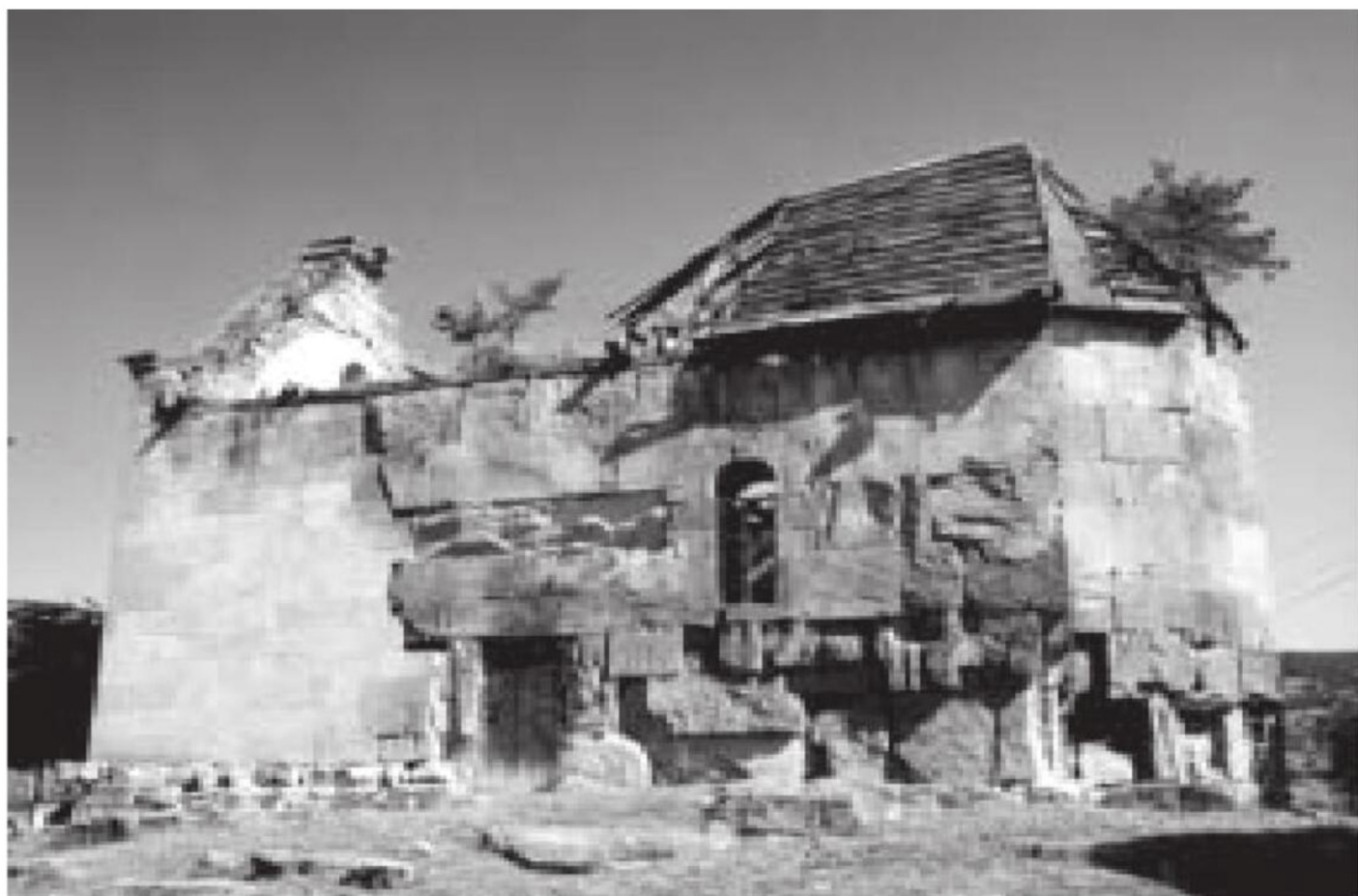
სურ. 1. აკაურთა. ეკლესიის სამხრეთი ფასადი