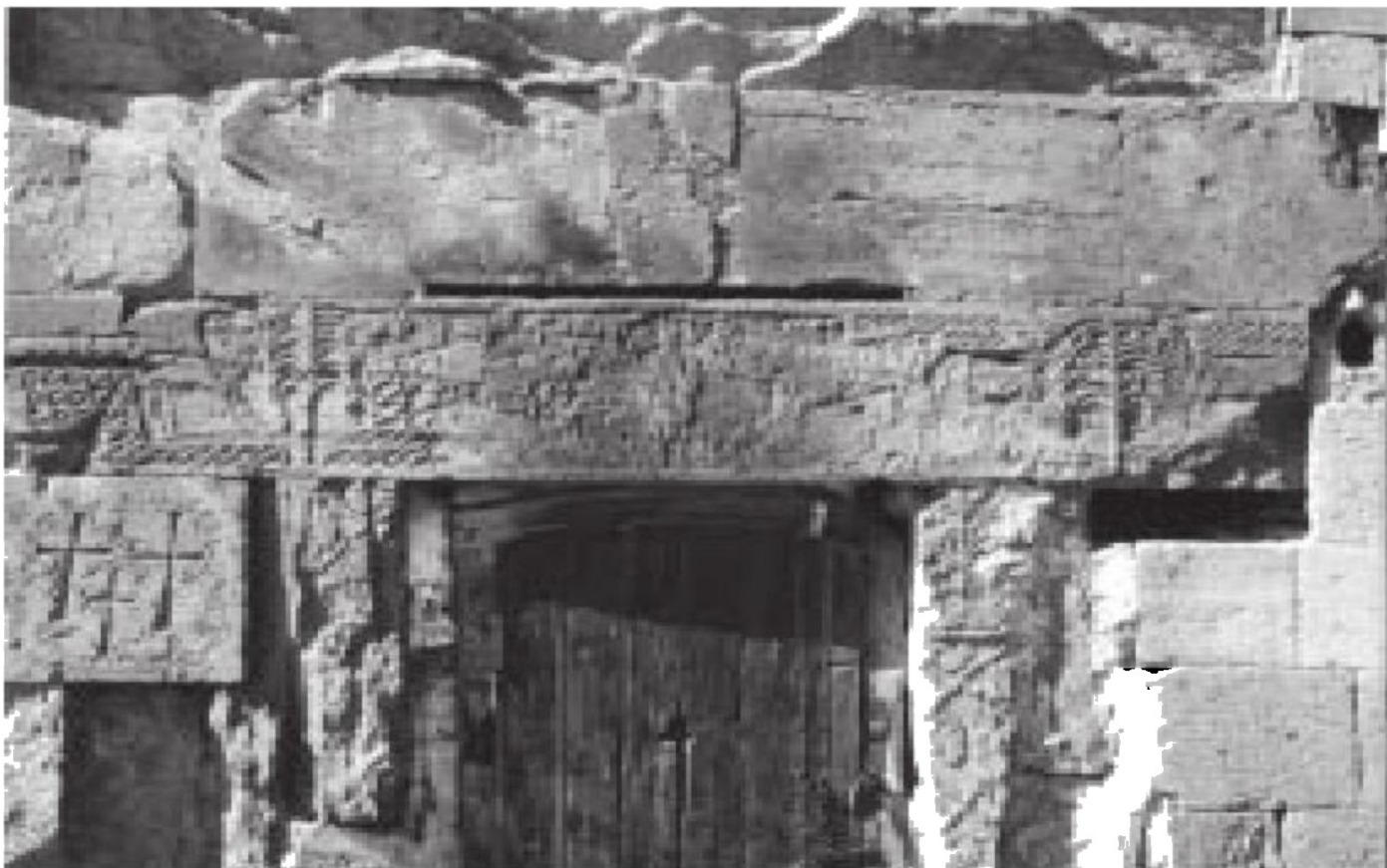
სურ. 3. აკაურთა, ეკლესიის სამხრეთი კარის ზღუდარი

წინასწარმეტყველის ფიგურის ამგვარი „მოძრაობა“ საკმაოდ გააზრებულა – იგი აღმოსავლეთისკენ, უფლისკენ არის მიმართული ღოცვა-ვედრებით. გარკვეულწილად წვეული იკონოგრაფიული სქემიდან გადახვევას წარმოადგენს ღომების ფიგურების განსხვავებული განაწილება და რაოდენობაც: მარცხნივ გამოსახული ღომი უფრო დიდი ზომისაა, ფილის მარჯვენა მხარეს ერთი შედარებით მცირე ზომის ღომია, მის ზემოთ კი – დანიელისკენ მიმართული კიდევ რამდენიმე პატარა (ცხოველის გამოსახულება, რომლებიც ზოგადი მოხაზულობით კვლავ ღომებს მოგვაგონებენ (გაიარჩევა მოძრაობაში გამოსახული სამი ცხოველის ფიგურა).