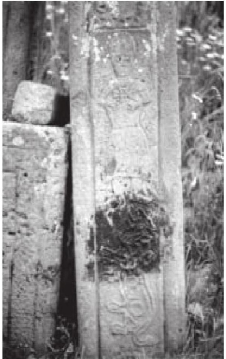
სურ. 5. ზედა თმოგვი. სტელა