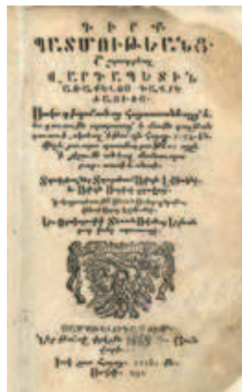
Титульный лист «Книги историй»