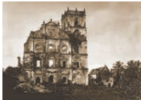
Церковь мона-ря Носа-Сеньора-да-Граса в Гоа (Индия)