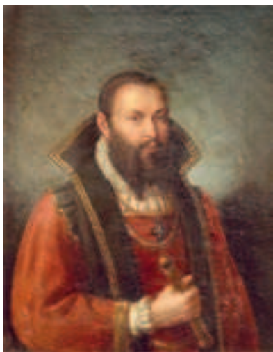
Г. Кетлер. 1888 г. Худож. Ю. И. Дёринг (частное собрание)

КЁТЛЕР [нем. Kettler, Ketteler] Готхард (ок. 1517 — 17.05.1587, Митау (Митава, ныне Елгава, Латвия)), последний ландмейстер Тевтонского (Немецкого) ордена в Ливонии (1559–1562), первый герц. Курляндии и Семигалии (с 1562); предста-