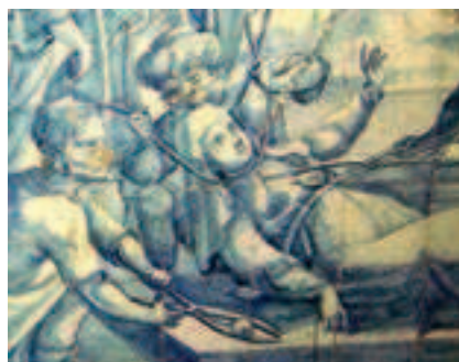
Сцена мученичества груз. царицы Кетеван. Панно-триптих из церкви августинского мона-ря Носа-Сеньора-да-Граса в Лиссабоне. После 1-й четв. XVIII в.

посольства, требовавшего освобождения К. Шах убедил московского посла, что К. умерла своей смертью, и вопрос о ее освобождении был снят (Амброзиу душ Анжуш. 1987. С. 39–40; Flannery. 2013. Р. 207).