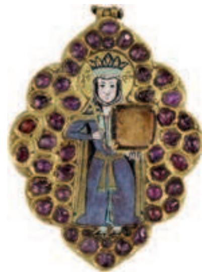
Панагия с изображением вми. Кетеван. Эмаль. XVII в. (СПГИАХМЗ)