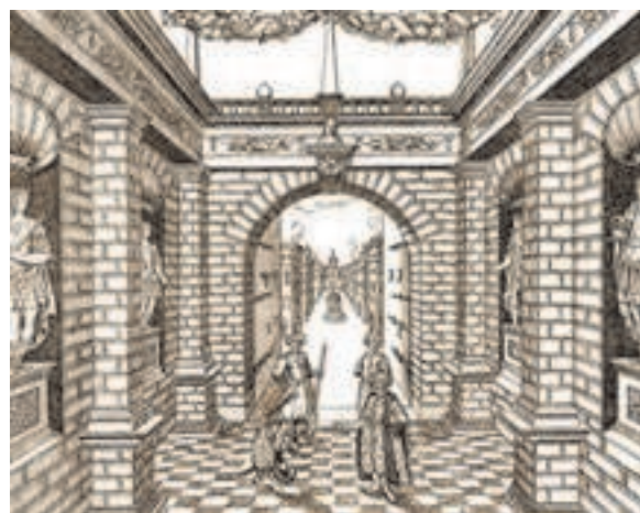
Сцена из драмы А. Грифиуса «Катерина Грузинская». Иллюстрация из кн.: Gryphius A. Deutsche Gedichte . Bresslaw, 1657. Bd. 1

В 1647 г. немецкий драматург Андреас Грифиус написал трагедию «Катерина Грузинская, или Стойкое сопротивление»