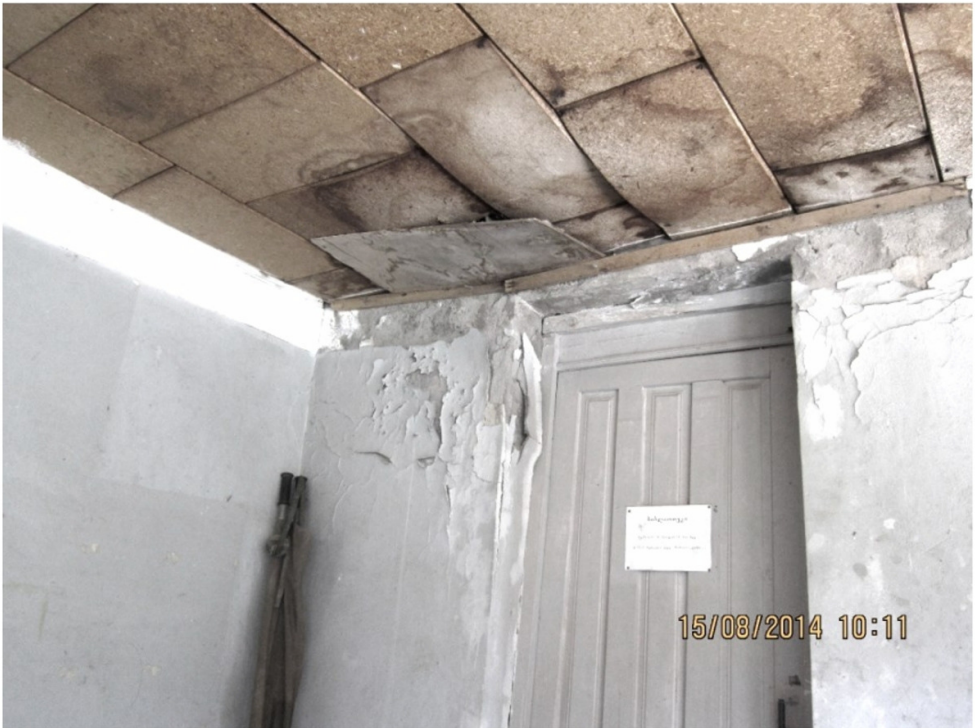
სოფ. საკრაულას ბიბლიოთეკა, საკრებულოს შენობა

დაეუშეათ მოვიყანეთ პროდუქტი, გასაღების ბაზრის პრობლემა დგება. მარტო ტყემლით, რომელსაც ვაბარებდით, ამ სოფელში იმდენი შემოსავალი იყო, რომ ტომრით ამოგვიტანია ფული. ახლა ადამიანების აზროვნებაც შეიცვალა, ისეთი ფსიქოლოგია ჩამოუყალიბდა, რომ მე ხელსაც არ გავანძრევ, სახელმწიფო ვაღდებული, დამეხმაროს. ოველწლიურად საწვავისა და შხამქიმიქატების უფასოდ მიცემას, სჯობდა მინიქარხნები გახსნილიყო, ხილის გადასამუშავებლად, სოფელში თუ არა, რაიონში მაინც, ან სხვა რამ. რაც უნდა დაეხმარო, ისე კი 600-700 ლარი რომ აჩუქონ, მაინც არაფერია, გაჭირვებული მაინც გაჭირვებულია, შრომა რცხვენია ხალხს და იმაზე წუწუნი, ეს არა მაქვს და ის არა მაქვსო, არ რცხვენია.