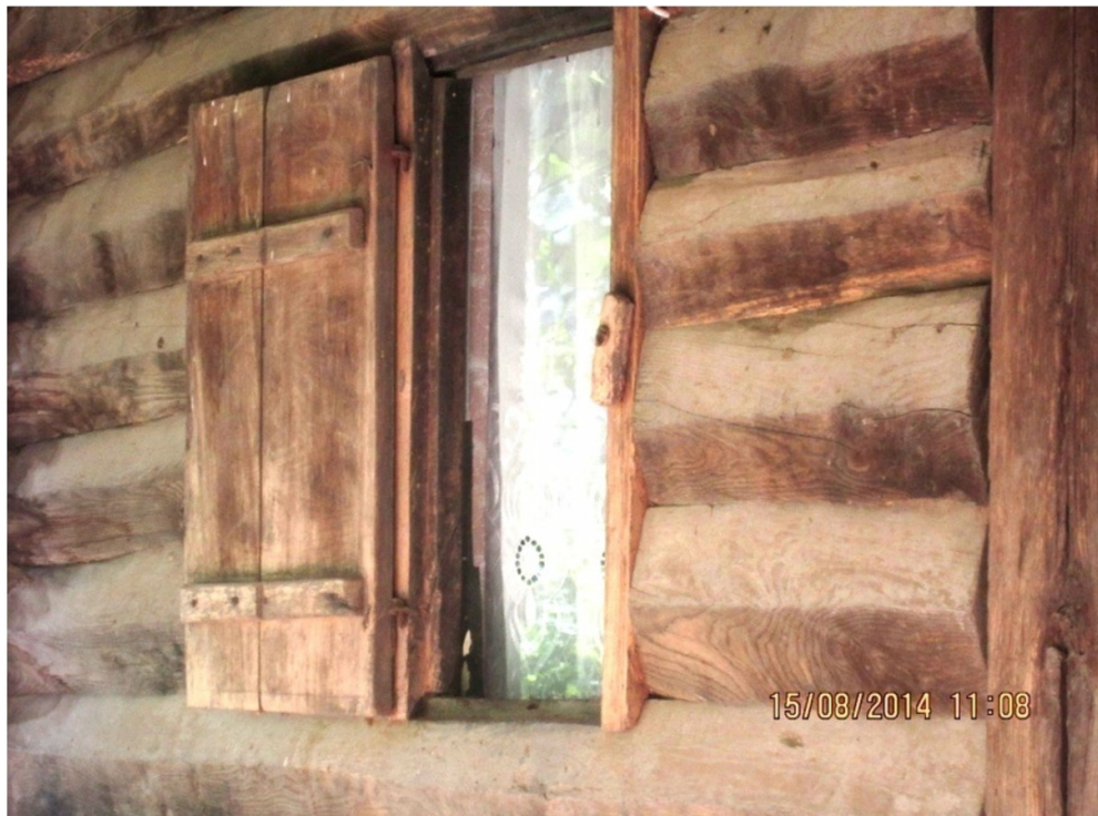
ძეღური სახლის ფრაგმენტი სოფ. საკრაულა

ფიცრებს და გააკეთა მადლა ზალო. მერე ბოეშებმა გადააკეთეს ეს სახლი“ (ხანდაზმული ქალბატონი სოფ. საკრაულიდან).