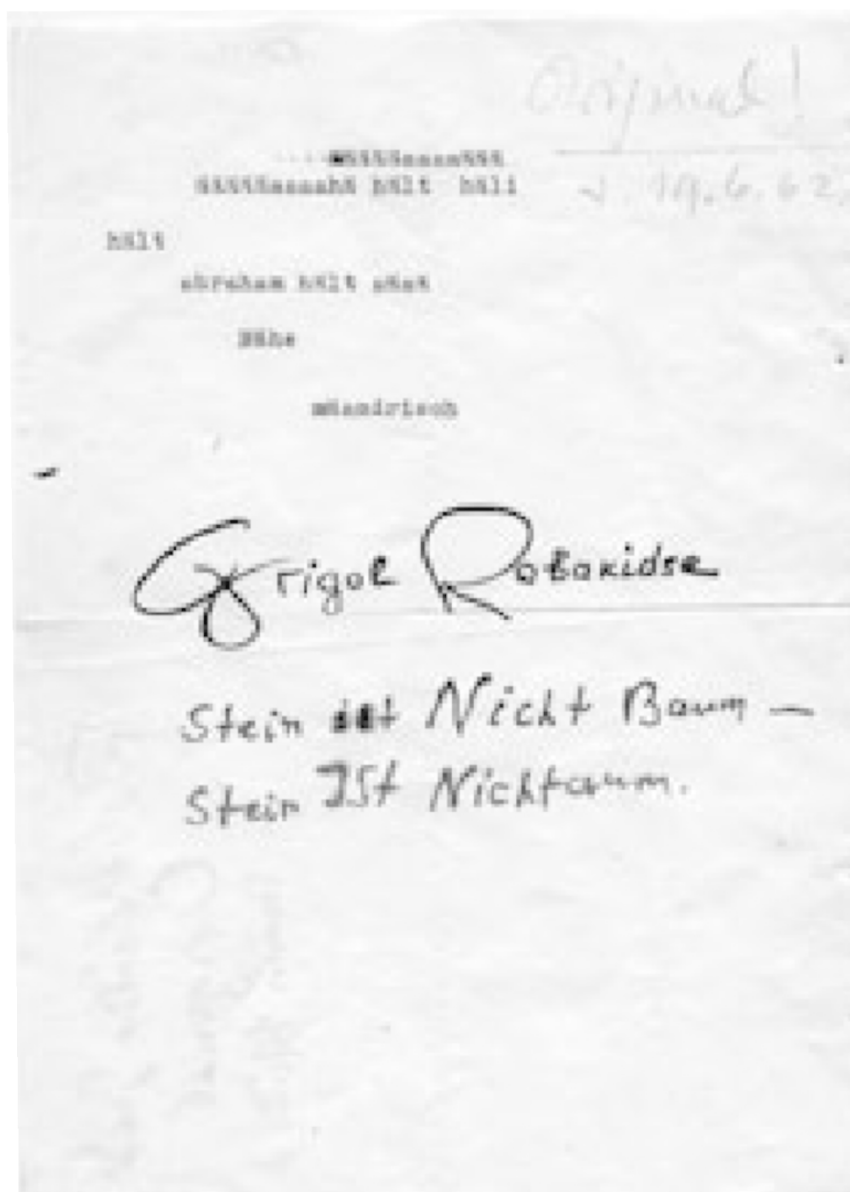
გრიგოლ რობაქიძის ხელნაწერი, 19 ივნისი, 1962 (ლალი ცომასი კერძო კოლექცია, თბილისი).

Grigol Robakidse Stein ist Nicht Baum - Stein IST Nichtaum. 1