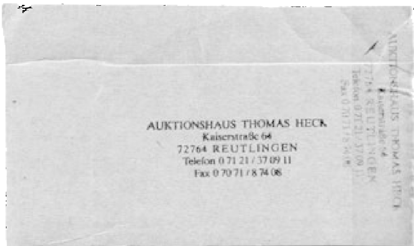
თომას ჰექის აუქციონის სერთიფიკატი.

ხელნაწერის მარჯვენა კუთხეში უცნობი ხელწერით წითელი ფანქრით მინერილია: „Original! 19.6.62“. 21