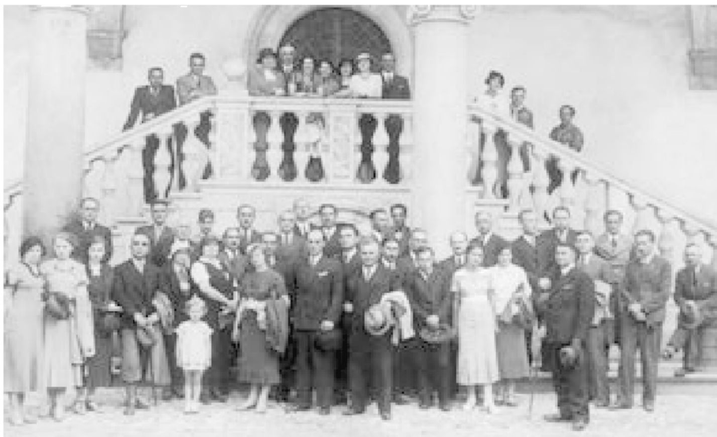
ქართველები ვაველში. კრაკოვი, 1935 წ.

ურობით გამოირჩეოდა კავკასიური სექცია. 1930 წლიდან „ახალგაზრდა ორიენტალისტთა წრე“ გამოსცემდა ჟურნალ „აღმოსავლეთს.“ ჟურნალი აქვეყნებდა სტატიებს საქართველოსა და კავკასიის შესახებ. საერთო ჯამში, ქრონიკისა და Miscellanea განყოფილებაში გამოქვეყნდა რამდენიმე ათეული სტატია, რეცენზია და ლიტერატურული მიმოხილვა საქართველოს თანამედროვე ისტორიაზე, პოლიტიკურ საკითხებზე და საქართველოს ისტორიასა და კულტურაზე. გამოქვეყნდა ლიტერატურული თარგმანები. სტატიის ავტორები ხშირ შემთხვევაში იყვნენ ქართველები. ჟურნალში ქვეყნდებოდა გიორგი ნაკაშიძის პუბლიკაციები. საგამომცემლო საქამიანობას ეწეოდა ინსტიტუტი. 1929 წელს აღმოსავლეთის ინსტიტუტმა გამოსცა იან (ივანე) ქავთარაძის წიგნი „გრუზია“ პოლონურ ენაზე .