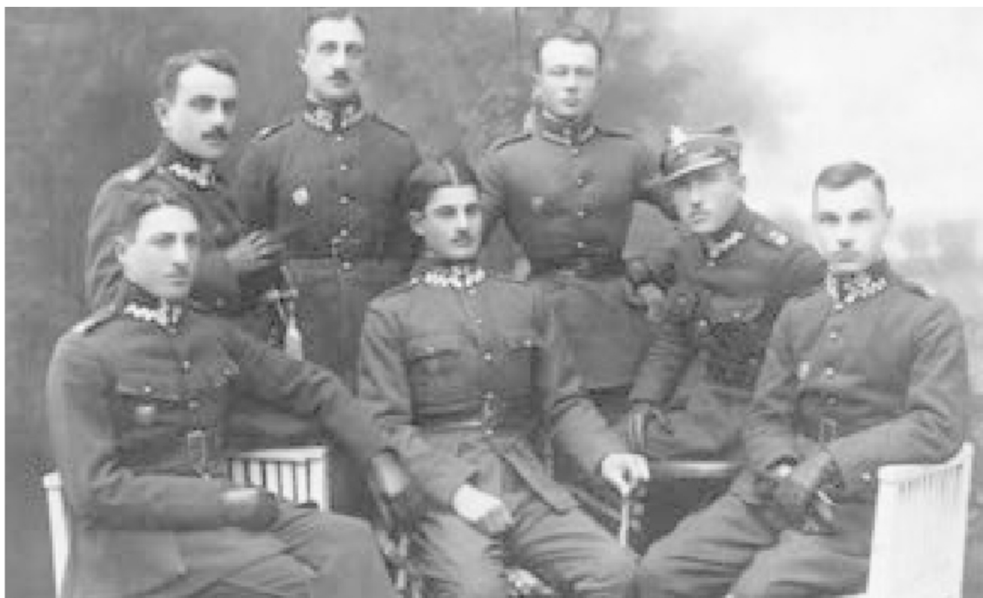
ქართველი ოფიცრები პოლონურ სამხედრო ფორმაში. ვარშავა, 1927 წ.